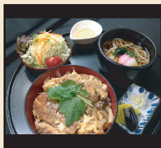
カツ丼セット(そば温)