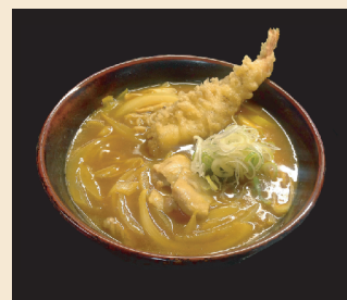
海老天カレー南蛮