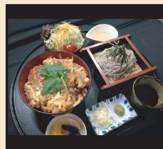
カツ丼セット(そば冷)